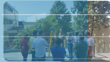
الشؤون الإداريّة والمساهمة